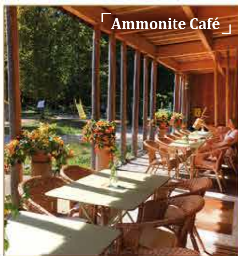
« Ammonite Café »