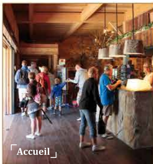
« Accueil »